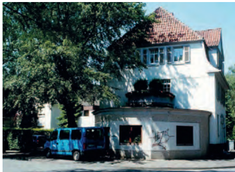
erste Tagespflege Gütersloh (1991)